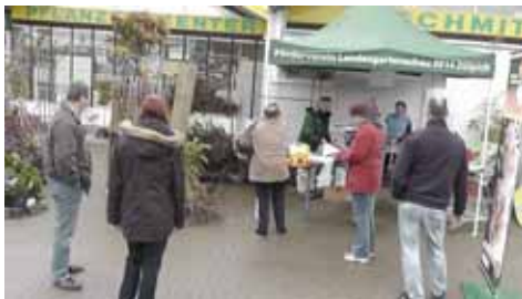
Pünktlich um 9.00 Uhr standen die ersten Kunden am Stand des Fördervereins um ihre Rose(n) in Empfang zu nehmen.

Die restlichen 400 für den freien Verkauf vorgesehenen Rosenpflanzen konnten über den Förderverein Laga 2014 Zülpich, und bei der Firma Schmitz vorbestellt werden. Trotz des schlechten Wetters (dagegen hatte Fa. Schmitz den ersten Glühwein spendiert) fanden sich bereits am ersten Tag der Ausgabe über 100 Rosenfreunde ein, um die ersten 200 Laga-Rosen abzuholen.